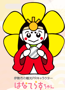
伊勢市の観光PRキャラクター はなてらすちゃん